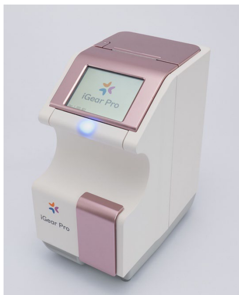
パック式臨床化学分析装置「アイギアプロ」

新製品は、測定時間は全て約5分間で、3項目の測定が可能ながら小型・軽量化、省スペース化を実現し、現場での使いやすさを徹底的に追求しています。なお、本製品は、従来の糖尿病専門医などから内科医・小児科医などへの販路拡大が見込めることで、初年度1,000台の出荷を計画しています。