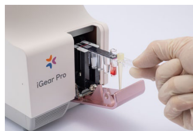
検体を採取したカートリッジ挿入シーン

当社では、2009年に糖尿病診断・治療の指標であるグリコヘモグロビン分析装置「A1c GEAR」と専用試薬「メディダス HbA1c」を国内で初めて開発し、2014年には次世代機「A1c iGear」を投入しました。これらの分析装置は、測定に必要な血液が全血1 \mu Lと微量で被検者の肉体的・精神的負担が軽減でき、約6分間で測定できる迅速さ、簡便さなどから、糖尿病専門医の医院、中小病院、クリニックなどで幅広く導入されています。